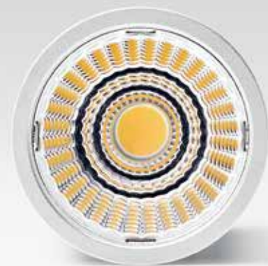
Module en taille réelle.

Convient pour le montage dans ou sur des meubles.